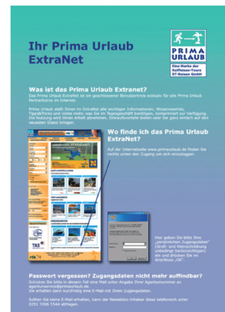
Prima Urlaub Extranet